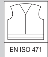
EN ISO 471

La présente directive de l'Inspection fédérale des installations à courant fort montre avec précision comment il convient d'aborder les tâches à exécuter dans le domaine de l'électricité. Les équipements de protection utilisés pour les divers travaux sont subdivisés en trois catégories conformément à une classification. Cette classification indique précisément à l'utilisateur la manière dont celui-ci doit se protéger pour exécuter la tâche correspondante.