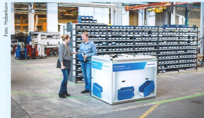
Der schnelle Ein- und Überblick – die Scan-Box verbindet die reale Lagerwelt mit der digitalen Lagerverwaltung.

Haberkorn ist in diesen Ländern „Official Partner“ von Festo. Durch die Kooperation mit Festo bietet Haberkorn Pneumatik-Komponenten aus einer Hand – Logistik der Superlative inklusive.