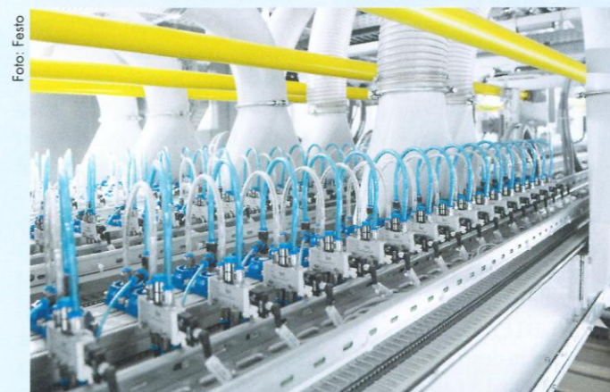
Haberkorn stellt gemeinsam mit Festo sicher, dass stets die gewünschte Menge pneumatischer Komponenten verfügbar ist.

Mit den passenden E-Business- und Logistik-Lösungen lassen sich Zeit und Geld sparen. Haberkorn zeigt, wie schlanke Logistik für schlanke Kosten sorgt.